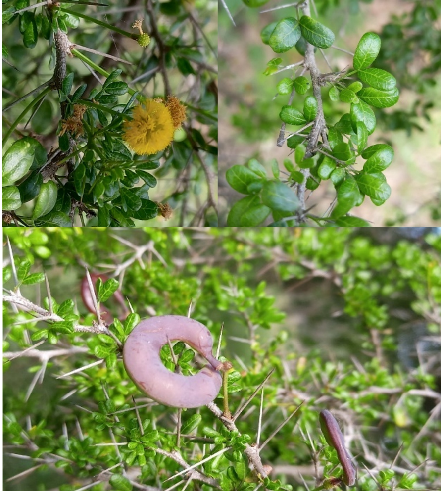
Figura 5. Vachellia roigii en el Refugio de Vida Silvestre Bahía de Malagueta.