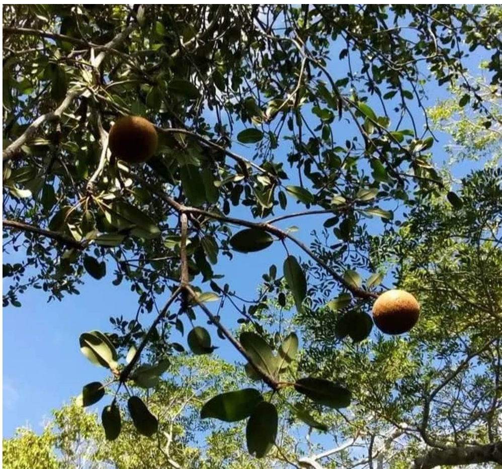
Figura 4. Manilkara jaimiqui subsp. Wrightiana en el Refugio de Vida Silvestre Bahía de Malagueta. Imágenes tomadas por Alvaro Fernández.

También son consideradas especies medicinales Z. pistaciifolium debido a que sus hojas tienen propiedades antimicrobianas y antioxidantes (Díaz et al. , 2023) y Garcinia aristata (Griseb.) Borhidi especie nativa categorizada (CR) cuya resina se usa como anticatarral y antiasmático (Godínez & Volpato, 2008)