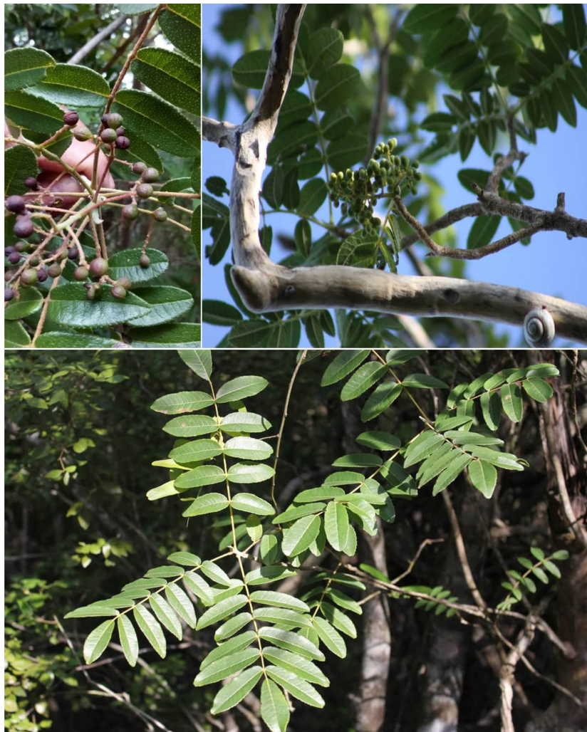
Figura 3. Zanthoxylum pistaciifolium en el Refugio de Vida Silvestre Bahía de Malagueta.

Entre las especies analizadas se destaca la presencia de Manilkara jaimiqui subsp. Wrightiana (Pierre) Cronquist (Figura 4). Esta especie es un frutal endémico categorizado (EN) cuya madera ha sido utilizada en traviesas de ferrocarril y en construcciones navales debido a su gran calidad (Gutiérrez, 2002). Otra especie de interés económico es Guaiacum officinale L, la cual está categorizada como (A) y según su distribución es nativa. Esta especie presenta una madera dura y resinosa que también ha sido utilizada para construcciones navales. Además, su corteza y resina tienen propiedades medicinales (Albert, 2017).